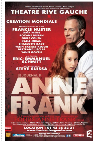
L'affiche de la pièce de théâtre.