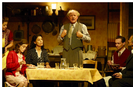
Les personnages confinés dans l'Annexe