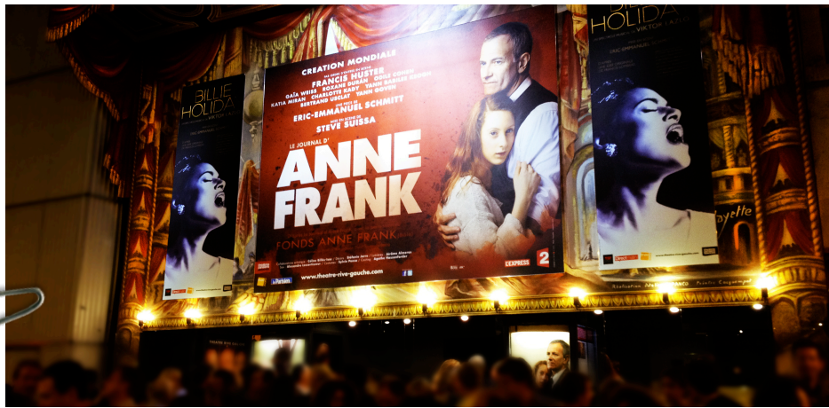
La pièce événement Le Journal d'Anne Frank au Théâtre Rive Gauche